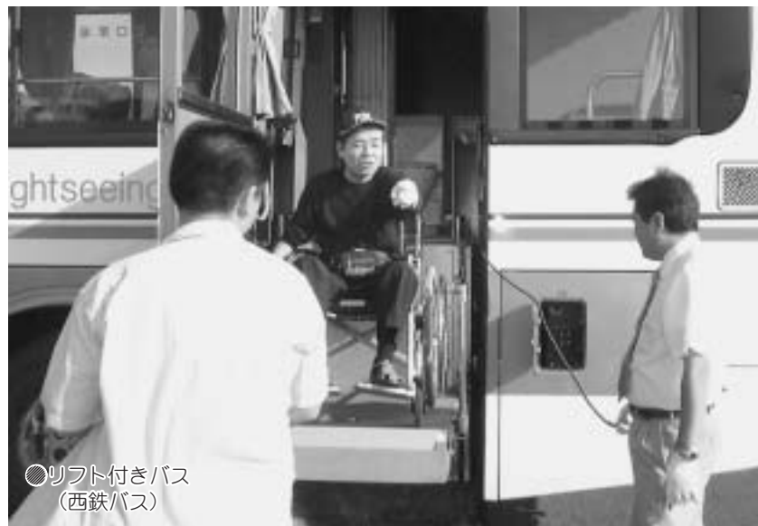
●リフト付きバス (西鉄バス)

今回の移動ではUSJの時と同様リフト付バスを利用する事になりさすがに以前のおんぶに抱っこでのバス乗降と違い介助される方もする人も危険を伴わず介助できた事は何よりの進歩だと思いました。しかし福祉車両バスについてはまだまだ台数やレンタル料など改善してもらいたい事も多くその問題が一日も早く改善できる事を願わずにはられません。