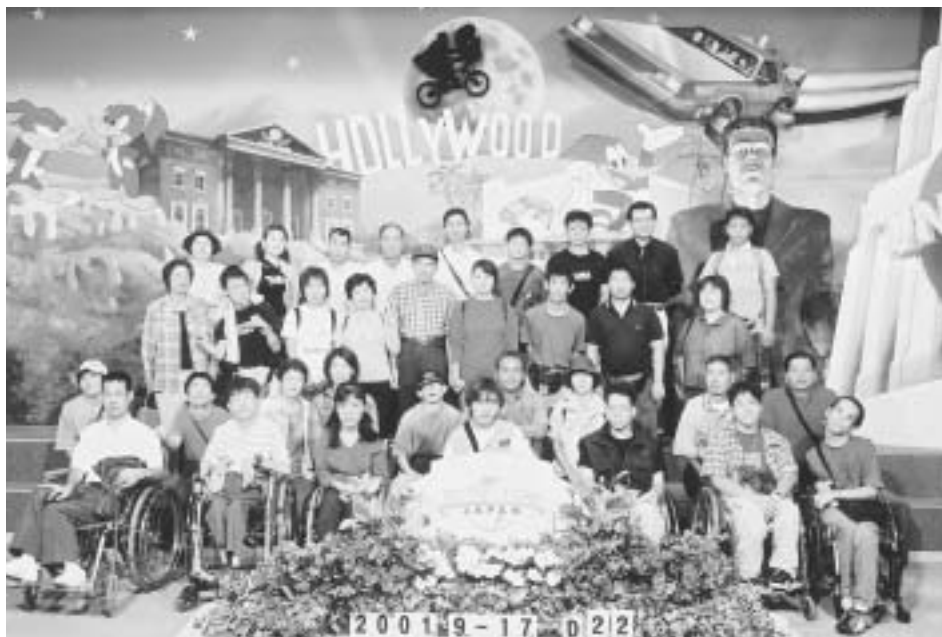
●ユニバーサル・スタジオ ジャパン内