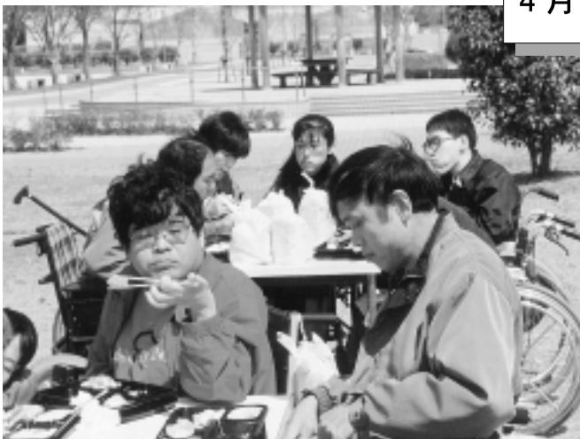
花見 平成12年4月1日(土)晴 (中原公園)