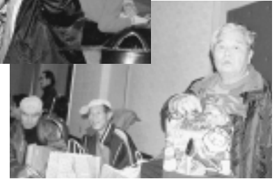
クリスマス会 平成11年12月23日(木)晴 (三田川町総合福祉センター)