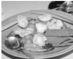
食事会 平成12年3月24日(金) (マリトピア)