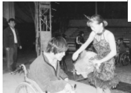
「ザ・ポップサーカス」観覧 平成11年12月23日(木)晴 (佐賀市久保泉工業団地内)